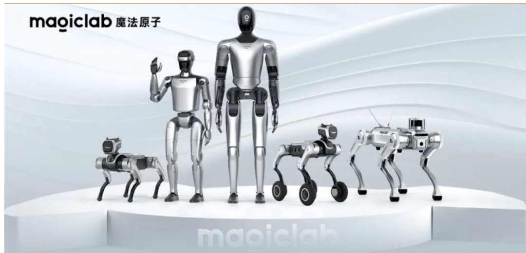
图2：魔法原子产品系列

魔法原子成为春晚智能机器人战略合作伙伴。 1月23日，中央广播电视总台与魔法原子携手官宣：魔法原子正式成为中央广播电视总台2026年春节联欢晚会智能机器人战略合作伙伴。魔法原子旗下有通用人形机器人、四足狗等经典机器人：明星机器人 MagicBot Z1（小人形机器人），MagicDog（四足狗），MagicDog W（轮足狗），MagicBot Gen1（大人形机器人）。