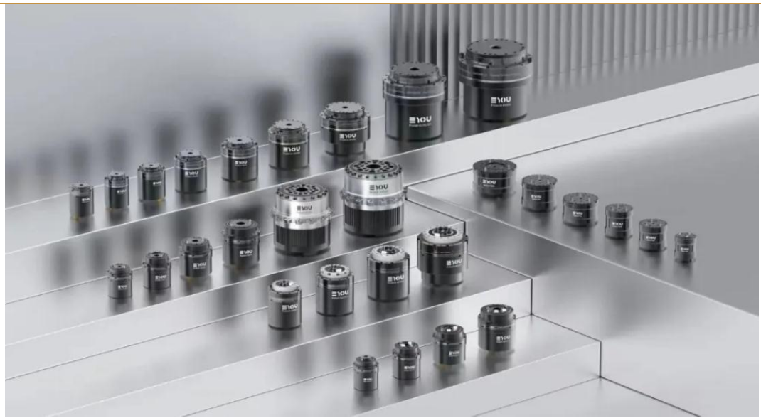
图 3：意优科技发布全新关节模组产品矩阵